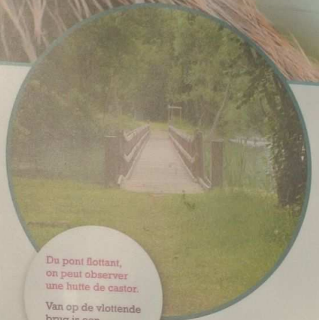
Du pont flottant, on peut observer une hutte de castor.

Dat is een van de redenen waarom de Bever bomen velt. Hij doet het ook om aan voldoende hout te komen voor zijn dammen en 'burchten', schuilplaatsen die bedekt zijn met ontschorste wilgentakken.