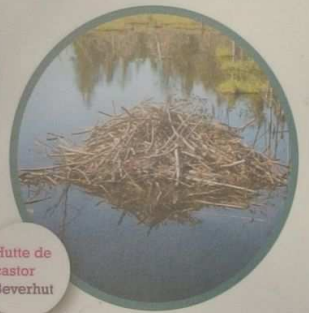
Hutte de castor Beverhut

Van op de vlottende brug is een beverhut te zien.